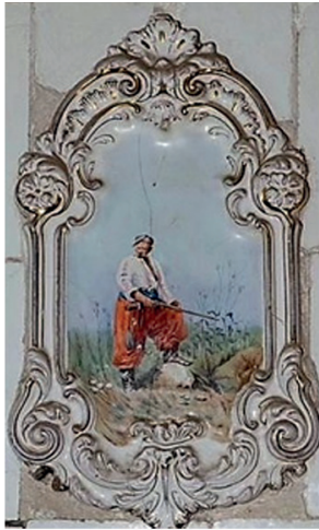
Рис. 4. Запорозький козак на кахлі-панно з печі в станиці Вознесенська (Краснодарський край, фото Д. Гангур, 2015 р.).