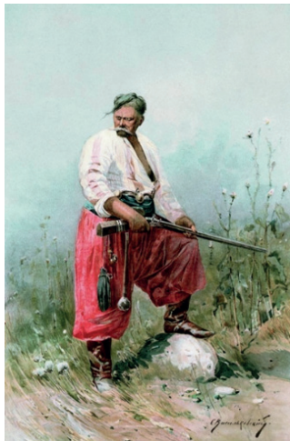
Рис. 5. Сучасна репродукція картини С. Васильківського «Запорожець»