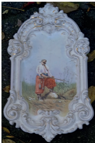
Рис. 7. Кахля-панно, розписана надглазурним розписом за мотивами картини С. Васильківського «Запорожець» в зібранні майбутнього музею кахельного мистецтва Старої Одеси. м. Одеса. 2025 р.

обличчі козака. Сподіваймося, що реставрація, яку буде проведено в майбутньому, виправить цей недолік. Розпис виконано дуже тонко, вправно, на високому професійному рівні. Незважаючи на те, що сюжет є повним