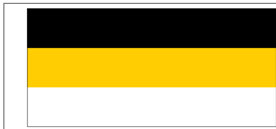
Рис. 2. Зразок зображення імперського прапора

воний триколон представляв лише росію; із 1990-х років ним користуються монархісти та ультраправі політичні угруповання [4] (рис. 2, 3).