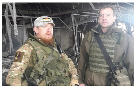
Рис. 5. Терорист Арсен Павлов «Моторола» із символікою свого батальйону під час боїв на Сході України

Літеру «М» взято із творів Дмитра Глуховського «Метро 2033» та однойменної серії комп'ютерних ігор,