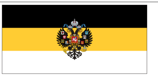
Рис. 3. Версія прапора з гербом

Починаючи з 2014 року символікою російської імперії користуються незаконні терористичні угруповання самопроголошених республік, так званих «ДНР» та «ЛНР», і до сьогодні — наприклад, 80-й окремий гвардійський розвідувальний батальйон «Спарта» імені Арсена Павлова, який належить 1-му армійському корпусу російської федерації. Це незаконне збройне формування було включено до санкційних списків низки країн. Воно брало участь у боях на схо-