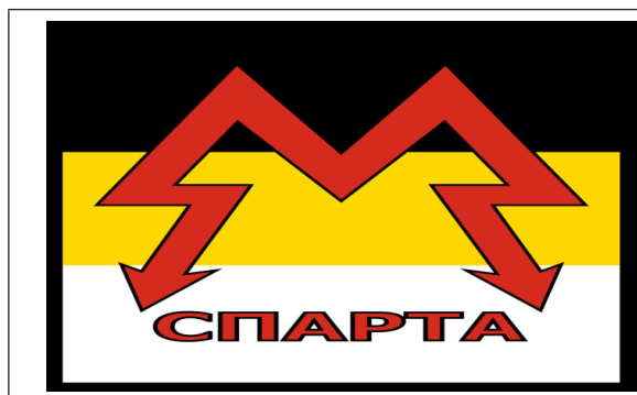
Рис. 4. Емблема батальйону «Спарта»

Бійці батальйону «Спарта» носять камуфльовану форму з емблемою батальйону на розпізнавальних знаках (нарукавних, на береті) — чорно-жовто-білий прапор російської імперії, поверх якого розміщено стилізовану під блискавку червону літеру М, а під нею — напис «Спарта» (рис. 4, 5).